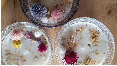
norma nf en 15494

En Francia y la Unión Europea, la venta de velas y fundentes perfumados está sujeta a una legislación estricta. Tanto si vende velas artesanales en mercadillos, en una tienda, en su sitio web o incluso en ventas privadas a domicilio, está sujeto a determinadas obligaciones legales. Además de las fichas de datos de seguridad, las velas deben etiquetarse de acuerdo con las dos normas vigentes definidas por la norma NF EN 15494 y el reglamento CLP. Tenja en cuenta que la Dirección General de Competencia y Consumo (DGCCRF) realiza controles periódicos de los puntos de venta. Y si decide no seguir estas obligaciones legales, debe saber que se arriesga a una multa de hasta 50.000 euros y 3 años de cárcel.