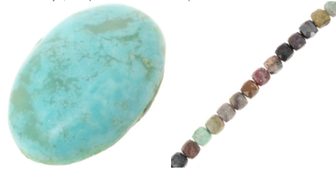
cabujón oval de turquesa

Para los navajos, la turquesa eran trozos de cielo que habían caído a la tierra.