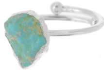
Anillo de drusa de turquesa auténtica