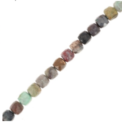
Cuentas cúbicas facetadas de turquesa natural