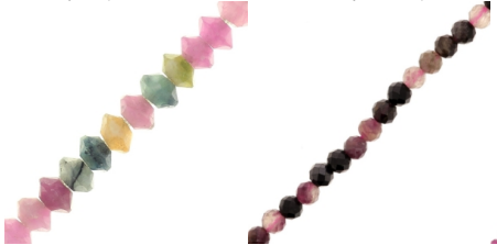
Cuentas redondas de turmalina facetada