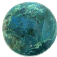
Colgante de crisocola de plata 925