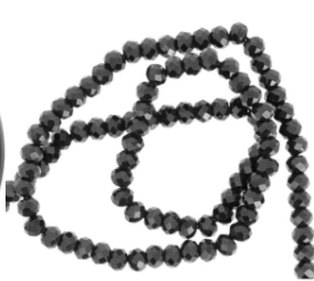
Cuentas redondas facetadas aplanadas en espinela negra