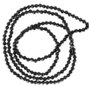
Cuentas redondas facetadas de espinela negra

La espinela negra tiene poder magnético. Por eso se utilizaba como pivote central en las brújulas de los barcos, que indicaban el norte a los marineros, permitiéndoles mantener el rumbo y orientarse correctamente. Desempeñó un papel crucial en los Grandes Descubrimientos.