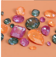
Aurora: cristal europeo con reflejos únicos.

¿Quieres saber más? Todo está explicado en nuestro artículo Swarovski o PureCrystal: ¿cuáles son las diferencias?