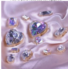
Preciosa: excelencia checa.

La marca checa Preciosa es una institución en el mundo del cristal. Fundada en Jablonec nad Nisou, en Bohemia, es famosa por la calidad de sus perlas nacaradas y la precisión de su tallado.