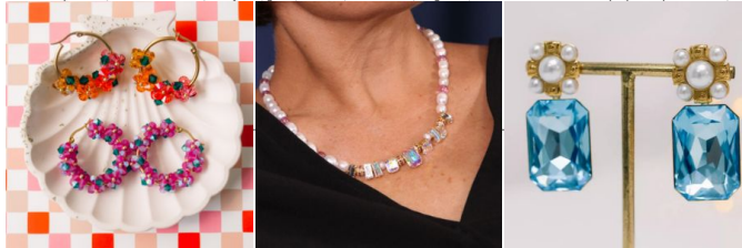
Swarovski: la referencia del cristal de prestigio.

Los cristales se presentan en múltiples formas: peonzas, cuentas redondas, cabujones, gotas, navettes, strass, hoflix, colgantes, etc. Cada marca tiene sus propias especialidades, acabados exclusivos y gama de colores.