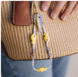
Llavero con colgante de pez hecho con cuentas de Rocalla: un accesorio divertido y rápido de hacer, perfecto para descubrir el tejido con cuentas de Rocalla.

Ya tienes todos los colores a tu alcance, ¡es hora de ponerse manos a la obra! Aquí tienes una selección de tutoriales para empezar: