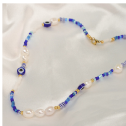
Collar azul y blanco: un clásico atemporal, una joya fácil de combinar con un look veraniego.

Nuestro consejo de experto: si buscas colores que se mantengan vivos y resistan el verano, opta por los tonos Duracoat, que son más duraderos.