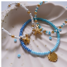
Pulseras marineras con cuentas de Rocalla: ideales para poner en práctica tus combinaciones de azules y blancos.