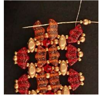
40) Colocar 1 R15, 1 P3 y 1 R15 en el tercer agujero de la Délos