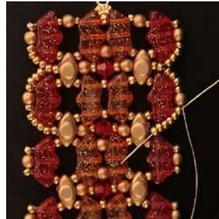
59) Pasar por las 6 R11