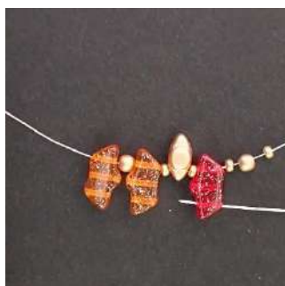
2) Pasar por el 3er agujero del Délos