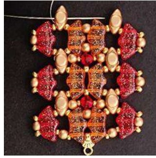
38) Repetir los pasos del 10 al 36, 3 veces