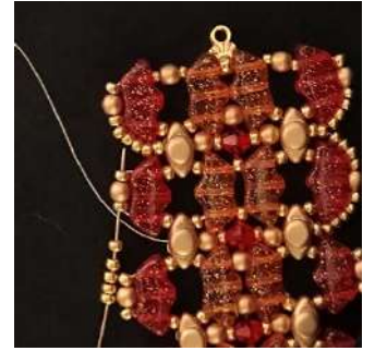
56) Colocar 5 R11 en la R11, la P3 y la R11