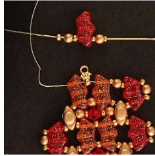
42) Colocar 1 R15, 1 P3, 1 R15, 1 Délos, 1 R11, 1 P3, 1 R11