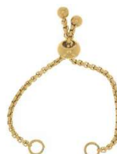
1 cierre a elegir