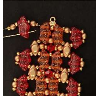
43) Pasar por el primer agujero de la Délos