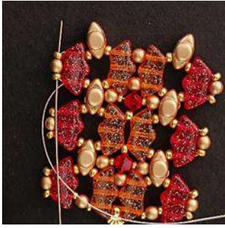
37) Pasar por la R11, la P3 y la R11