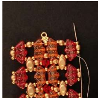
46) Pasar por la R11, la P3 y la R11