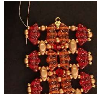
48) Pasar por la P3 y la R11