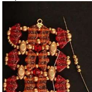
50) Colocar 5 R11 en la R11, la P3 y la R11