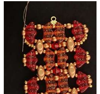
52) Pasar por la R11, la P3 y la R11.