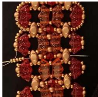
62) Colocar 5 R11 en el agujero central de la Volos y pasar por todas las perlas