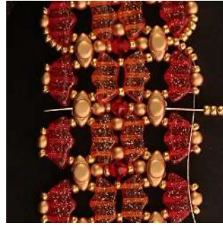
55) Colocar 5 R11 en el agujero central de la Volos y atravesar todas las perlas