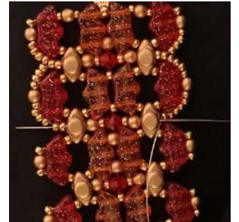
60) Pasar por todas las perlas y las 2 R11