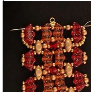
51) Pasar por todas las perlas