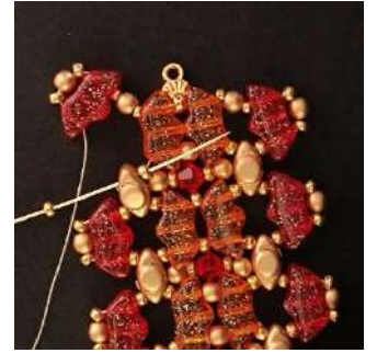
44) Colocar 1 R11 en la Volos, la R11