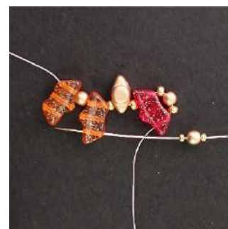
4) Colocar 1 R15, 1 P3, 1 R15 en el 3er agujero del Delos