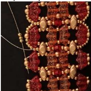
61) Colocar 3 R11 en la R11, la P3 y la R11