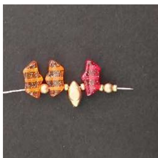
1) Colocar 1 Délos, 1 P3, 1 R11, 1 Volos, 1 R11, 1 Délos, 1 R11, 1 P3, 1 R11

Asegúrate de colocar los «Délos» y los «Volos» tal y como se muestra en las fotos.