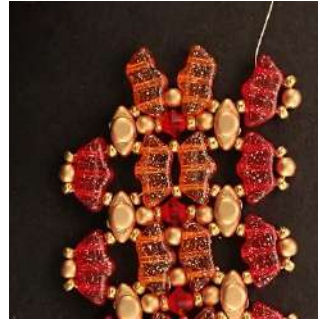
39) Repetir los pasos del 11 al 30, de la siguiente manera