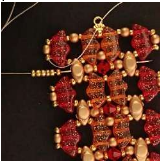
49) Colocar 5 R11 en el agujero central de la Volos y pasar por todas las perlas