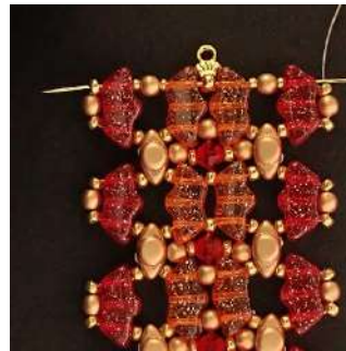
47) Pasar por todas las perlas