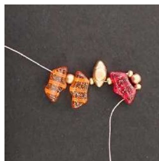
3) Como esto