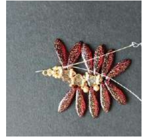
20) Pasar en los Rocallas