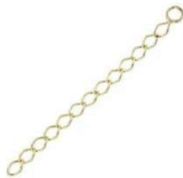
1 cadena de extensión