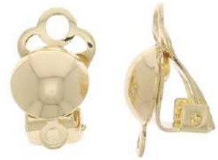
2 clips para pendientes de media bola