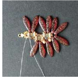
18) Hacer un doble nudo con el hilo restante