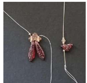
4) Colocar 1 R15, 1 Hélios, 1 R15, 1 T3 y 1 R15.