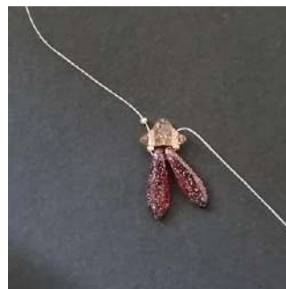
3) Esto es lo que obtienes.