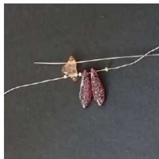
2) Pasar por el segundo orificio del Hélios.