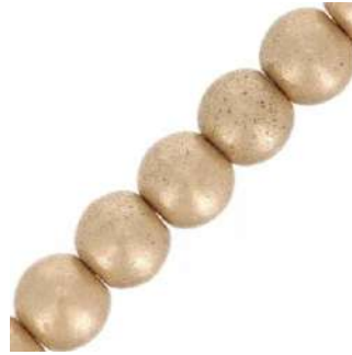
41 perlas redondas de 3 mm (P3)