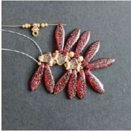
17) Colocar 1 R15, 1 R11, 1 R15, 1 Pilos, 1 R15, 1 R11, 1 R15