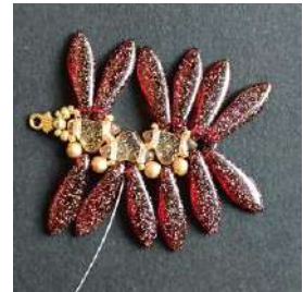
24) Esto es lo que obtienes.