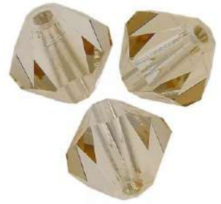
9 Tupis 3 mm (T3)