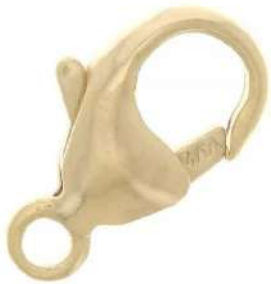
1 cierre de mosquetón