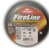
Filo Fireline 0.12