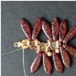
21) Pasar en el Pilos, las rocallas