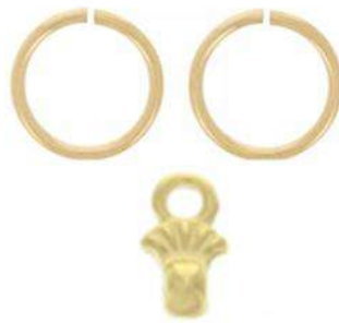
6 anillas de 4 mm 4 Cymbal Pilos