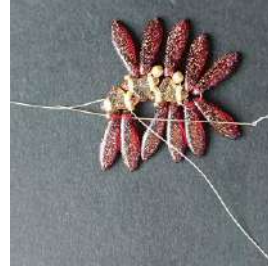
15) Pasar en las 2 Daggers, la R15