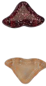
25 Hélios® (9 en los colores de los Daggers si son de 2 colores) par Puca®-Paris