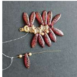
22) Colocar 1 P3, 1 Dagger, 1 P3