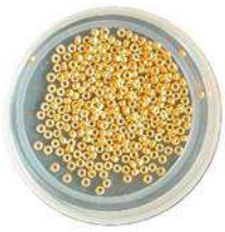
Rocallas 15/0 (R15) Rocallas 11/0 (R11)