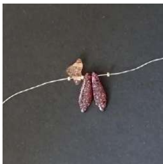
1) Colocar 1 R15, 1 Hélios (en esta posición), 1 R15, 2 Daggers y 1 R15.