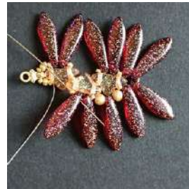
23) Pasar en el R15, el siguiente Dagger