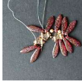
14) Pasar en el Daggers, la R15, el Helios, la R15, el Helios, la R15