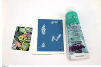
Espera 10 minutos para que la primera prueba aplicada se seque antes de colocar la cartografía número dos y un segundo color.

Para pequeñas pendientes originales y coloridos hechos de arcilla polimérica con una superficie que permite tener un patrón de logo en 3 colores. Liga este paso a paso para conocer el uso de esta pantalla de impresión de pantalla que tiene la flexibilidad de estar compuesta de 1 logo con patrones que se superponen y un cumplimiento entre sí. Sigue una lista de cosas blancas después de pasar su diseño de colores a través de la industria de masas (Paso 5 de la industria blanca ). Ponga su superficie número uno sobre la arcilla polimérica, pona el diseño sobre la superficie y aplique su primer color. No olvide lavar la superficie inmediatamente bajo el agua con jabón.