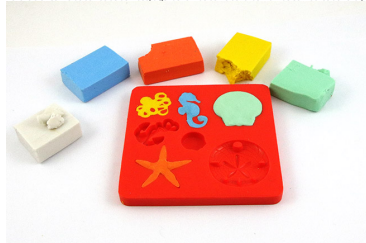
Paso 4 Voltee su molde para liberar a tus animales marinos.