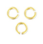
Anillas abiertas 3.3x0.6 mm Dorado con oro satinado x10 Ref : : OAC-1226 Cantidad : 2