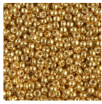
Rocalla Miyuki Duracoat 11/0 4202 - Galvanized Gold Ref : : MR11/4202 Cantidad : 1