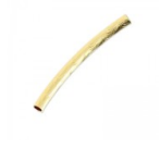
Tubo gravado 25x2 mm dorado x5 Ref : : MTL-807 Cantidad : 2