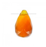
Gota facetada 6x9mm Red Agate x1 Ref : : SEM-770 Cantidad : 1