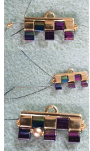
Figura 6. Rótula 1 RT15, 1 PR10, 1 RT13 y la zona de la toaca en el agujero izquierdo (foto 1). Rotuleo RT15 (foto 2) y largo lago por los agujeros derechos celebrando 1 RT15 antes y después de cada PR10 (foto 3).

Figura 1. Sección 2RTS hacia abajo y luego hacia la parte superior del tejido, pasando por los edificios de la Tila y los corredores para asegurar el tejido (foto 1). Luego regrese por los RTS y luego por los edificios de la Tila y los corredores para asegurar el tejido (foto 2). Retirar 1 RTS, 1 corredor redondo 8 mm (P8), 1 RTS y luego volver por el edificio de la Tila (foto 3).