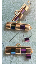
Figura 3. Región de punto 2 (zona 1). Una y cuatro por el relieve derecho del conector central, el segundo fila de la primera fila y el último conector.

Nota 2: Señalar 2 cruces de semillas (1,0) (1,1) y luego pase por el edificio derecho del conector (foto 1), Señalar 1 T5a, luego volver por el edificio derecho del conector (foto 2), del Ter T5a montado y del conector central (foto 3).