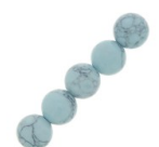
Cuentas redondas 4 mm de imitación Howlite tintadas- Azul claro x30 Ref : : GEM-507 Cantidad : 2