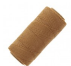
Bobina de hilo encerado Linhasita para micro macramé 0,5 mm Cinnamon (Pal 362x335m) Ref : : FIO-002 Cantidad : 1