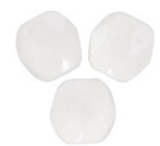
Facetadas 3 mm Chalkwhite Ceramic Look x50 Ref : : FAC-927 Cantidad : 1