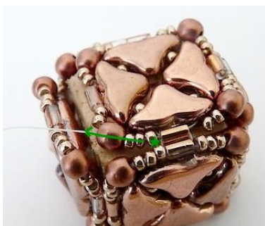
25) Placer 1 R15 et se placer dans la PR3