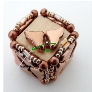
21) Placer 1 Helios, 1 R15, 1 Helios et répéter les étapes 3 à 5