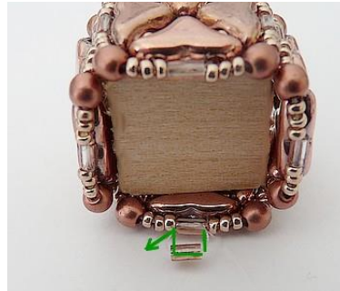
20) Placer 1 B3 dans votre B3 et consolider