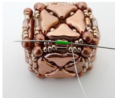
23) venir se placer ICI