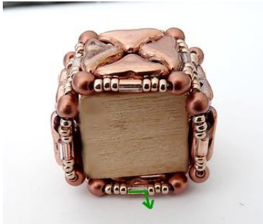
19) Placer votre cube en bois