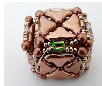
24) Zipper avec votre B3 du dessous. Se placer ICI