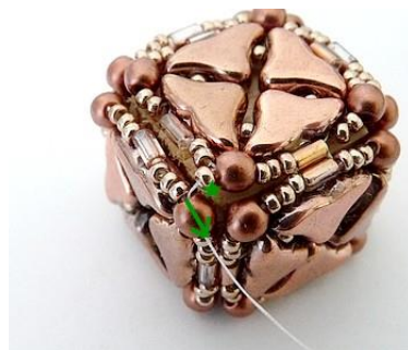
26) Placer 1 R15 dans la PR3 ICI