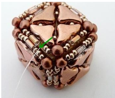
22) On obtient ceci 😊