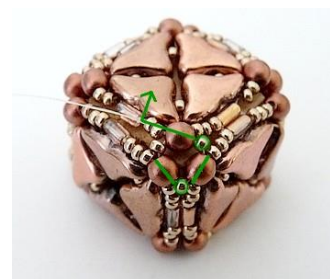
27) Répéter étape 26 deux fois et se placer ICI dans les deux R15