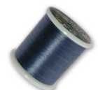
Hilo Ko 0.25 mm Denim Blue x50 m Ref : : UFC-728 Cantidad : 1