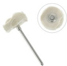
Cepillo pulidor circular banda de franela 21x6 mm x1 Ref : : TECH-758 Cantidad : 1