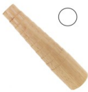
Herramienta para forjar pulsera de madera redondo x1 Ref : : TECH-448 Cantidad : 1