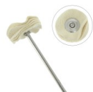
Cepillo pulidor circular de gamuza de cuero 22 mm x1 Ref : : TECH-759 Cantidad : 1