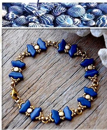
Delos® Opaque Curacao et Kalos® Light Gold Mat