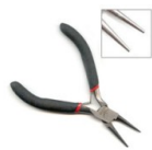
Alicate de punta redonda Eco Ref : : OUTIL-031 Cantidad : 1