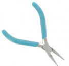
Pince ronde manche pailleté Ref : : OUTIL-134 Cantidad : 1