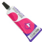
Pegamento para joyas Hasulith 30 ml Ref : : OUTIL-007 Cantidad : 1