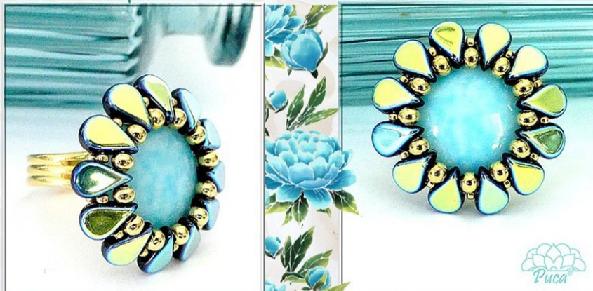
Cabochon Milky Turquoise 18 mm et Amos® Jet AB