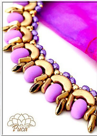
Samos® La Divine Lilac Mat Arcos® et Piros® Light Gold Mat