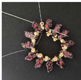
7) Passer dans la Delos