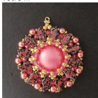
30) Faites un double nœud, couper votre fil