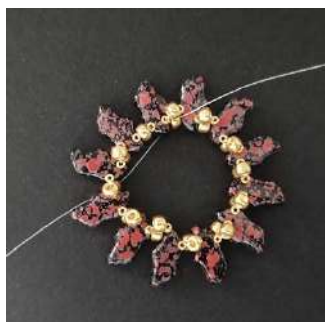
6) Vous obtenez ceci