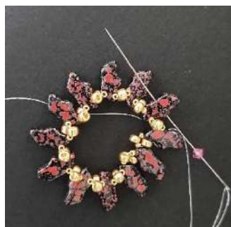
9) Placer une T3, entre chaque Delos (trou du milieu)