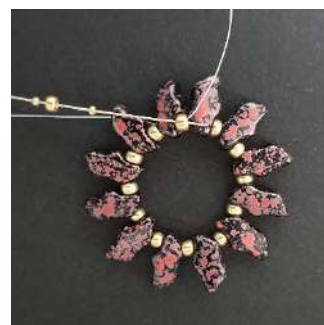
4) Placer 1 R15, 1 R8, 1 R15 dans la R8, comme ceci