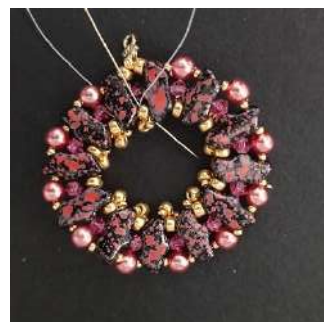
16) enfiler votre fil en attente passer dans la R8