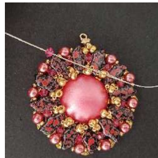
27) Enfiler le fil en attente. Placer 1 T3 dans la R8 suivante