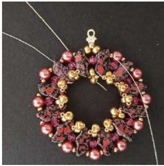
17) Comme ceci