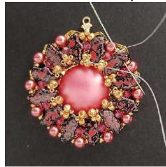
23) Passer dans la R15, la Delos