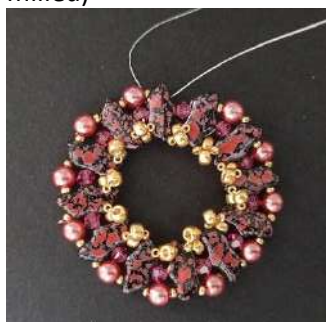
13) Vous obtenez ceci