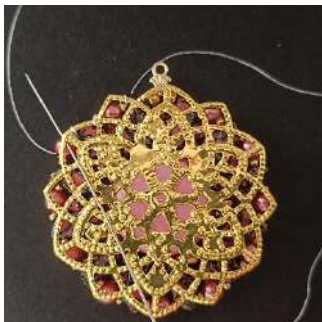
25) Comme ceci