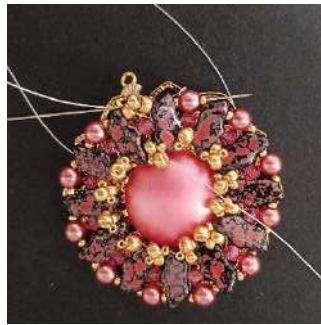
22) Passer dans la R15, la P4, la R15, puis répéter l'étape 21