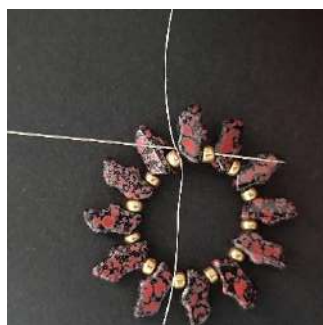
3) Passer dans la Delos, la R8