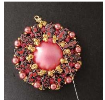
28) Comme ceci