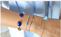
Este brazalete está hecho de un hilo de algodón y un hilo de lana. Corta dos piezas de hilo de algodón de 10 cm y dos piezas de hilo de lana de 10 cm. Luego, haz un nudo en cada extremo del hilo de algodón y en cada extremo del hilo de lana. Después, haz un nudo en el centro del hilo de algodón y en el centro del hilo de lana. Finalmente, haz un nudo en cada extremo del hilo de algodón y en cada extremo del hilo de lana.