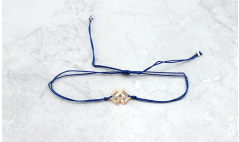
Figura 4 Para hacer este brazalete, necesitas un hilo de algodón y un hilo de lana. Corta el hilo de algodón en trozos de 10 cm y el hilo de lana en trozos de 10 cm. Luego, haz un nudo en cada extremo del hilo de algodón y en cada extremo del hilo de lana. Después, haz un nudo en el centro del hilo de algodón y en el centro del hilo de lana. Finalmente, haz un nudo en cada extremo del hilo de algodón y en cada extremo del hilo de lana.