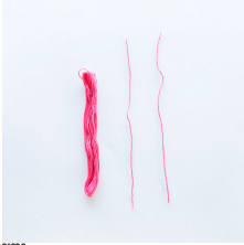
PASO 2 Con una de las dos piezas, ate un nudo en el medio de la madeja.

ETAPA 1 Cortar dos piezas de alambre sobre la longitud de la madeja