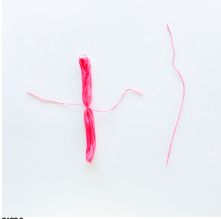
PASO 3 Doble la madeja de su entorno, donde se hizo un nudo en el hilo.