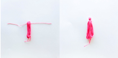
PASO 5 Corte a la longitud deseada. A continuación, repita el paso 2 a 5 dos veces para cada madeja de color (fucsia, caramelo de color rosa y rosa claro) durante 6 pompones en total.