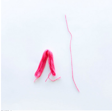
PASO 4 Atar el segundo trozo de alambre alrededor de la madeja plegada.