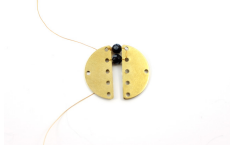
Seguirá concediendo otras perlas de la misma manera por el pensamiento de que el cable es visible desde un agujero a otro que un lado de los divisores. Uno de los lados debe ser similar a la foto: perlas una vez juntos, doble rudo con el hilo ya en su lugar y pasar el hilo en la última perla antes de cortar. Pon un toque de pegamento en los nodos para asegurarse de que no se caigan a pedazos.