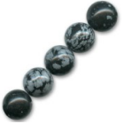
Cuentas Obsidiana moteada 4 mm x20 Ref : : SP-033 Cantidad : 1