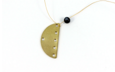
Paso 2: Entrar en el agujero opuesto de la otra pestalla y luego regresar en el cordón.