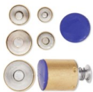
Surtido de sacabocados Kemper Aros x5 Ref : : OUT-163 Cantidad : 1