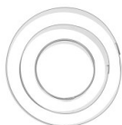
Sacabocados redondos x3 Ref : : OUTIL-076 Cantidad : 1