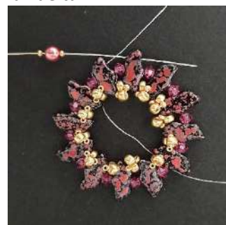
12) Colocar 1 R15, 1 P4, 1 R15 entre cada Delos (3er agujero)