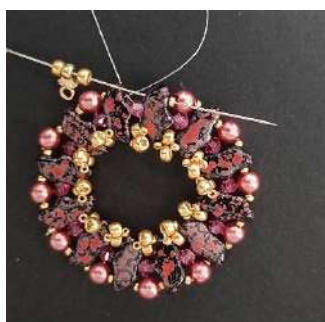
14) Para terminar, colocar 1 R8, 1 Pilos, 1 R8