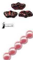
12 Delos® par Puca®-Paris Enamel Red