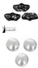
12 Delos® par Puca®-Paris Enamel Grey