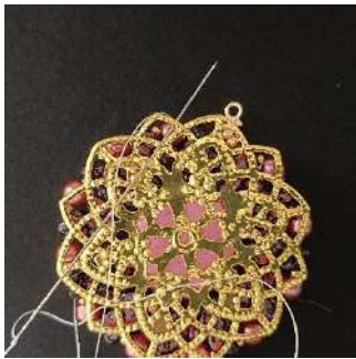
21) Pasar por la estampa, así