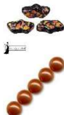
12 Delos® par Puca®-Paris Enamel Orange