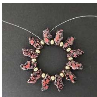
2) Dejar unos 30 cm de hilo suelto. Hacer un doble nudo