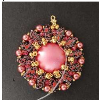
26) Una vez que hayas dado toda la vuelta, haz un doble nudo y corta el hilo