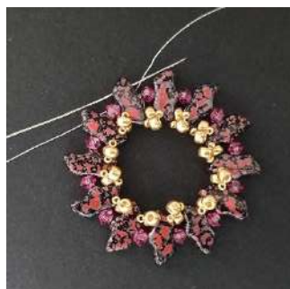
11) Pasar por el 3er agujero del Delos para dar la vuelta