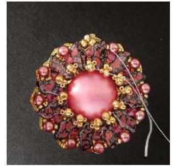
20) Colocar la corona de perlas