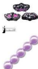
12 Delos® par Puca®-Paris Enamel Pink