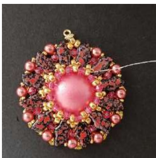
29) Colocar 1 T3, toda la vuelta como esta, apretar bien