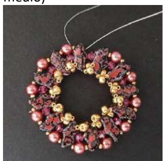
13) Se obtiene esto