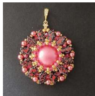
31) Colocar l'enganche para colgante. ¡Tu colgante está terminado!