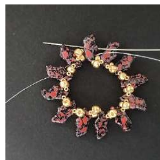
8) Pasar por el 2º agujero del Delos para dar la vuelta