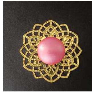
19) Pegue el cabujón en el centro de la estampa