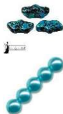
12 Delos® par Puca®-Paris Enamel Turquoise