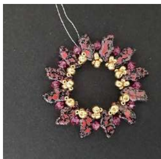
10) Se obtiene esto