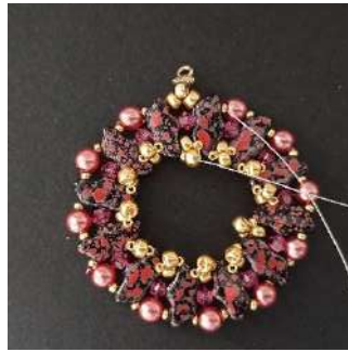
18) A continuación, pasar por la R15 y la R8