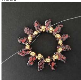
6) Queda así