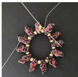
5) Pasar por el Delos y el R8 siguientes y repetir el paso 4 en toda la vuelta