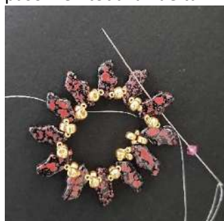
9) Colocar un T3 entre cada Delos (agujero del medio)