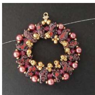
15) Se obtiene esto