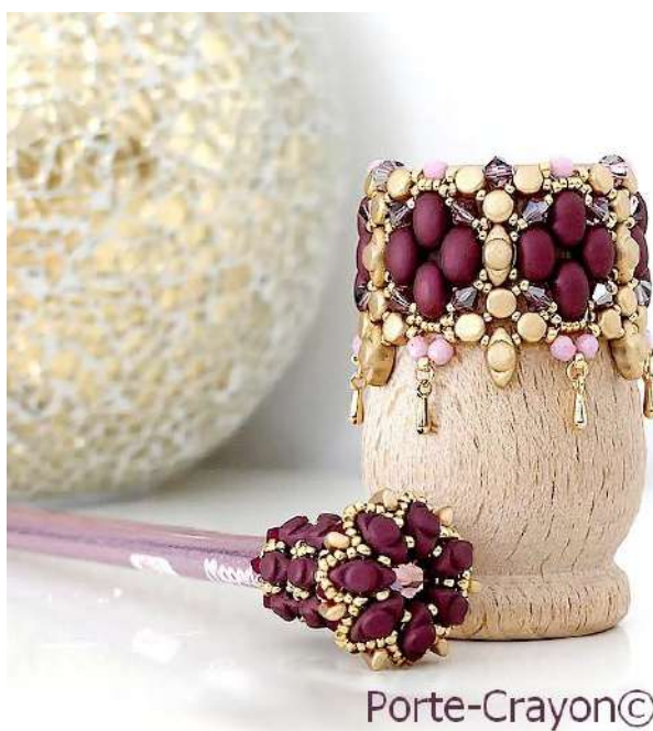
Porte-Crayon© par Puca®