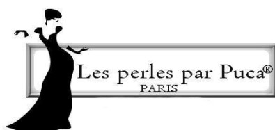
Schéma « Perle de Noël 2023 » © par PUCA®